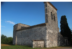
St Pierre de Cambot