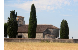
St Julien de la Serre