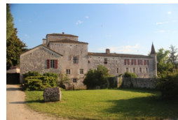
Moulin de Ferrussac