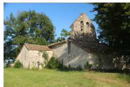
ND de Ferrussac