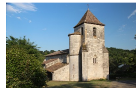
St Martin d'Anglars