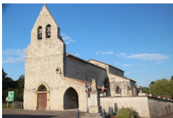
St Amans de Tayrac