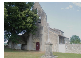
St Pierre del Pech