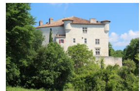
Château de Combebonnet