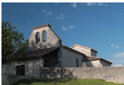
St Louis de Gandaille